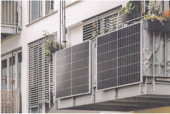
Balkonkraftwerke bieten einen Beitrag zur Energiewende

„Vor unserem Haus steht ein großer Baum, der viel Schatten wirft. Lohnt sich das trotzdem?“