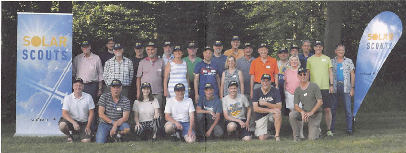
DIE SOLARSCOUTS: 70 ehrenamtlich Bürgerinnen und Bürger engagieren sich derzeit in den Bezirken der Landeshauptstadt.